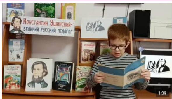
Видео от Библиотека "Солнечная" на Сиреневом 163 просмотра