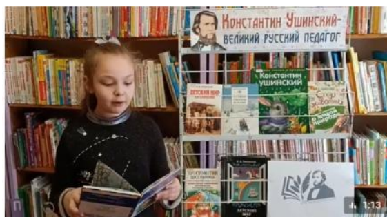
Видео от Библиотека "Солнечная" на Сиреневом 164 просмотра