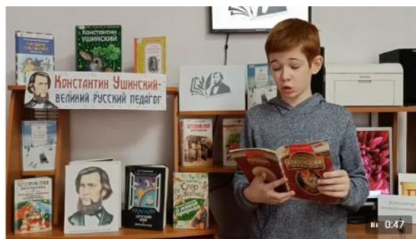
Видео от Библиотека "Солнечная" на Сиреневом 420 просмотров