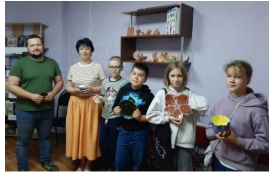
✓ Проект «Навигатор знаний».